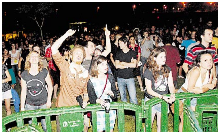
El públic va animar grups com Maga, Mazoni o Infadels