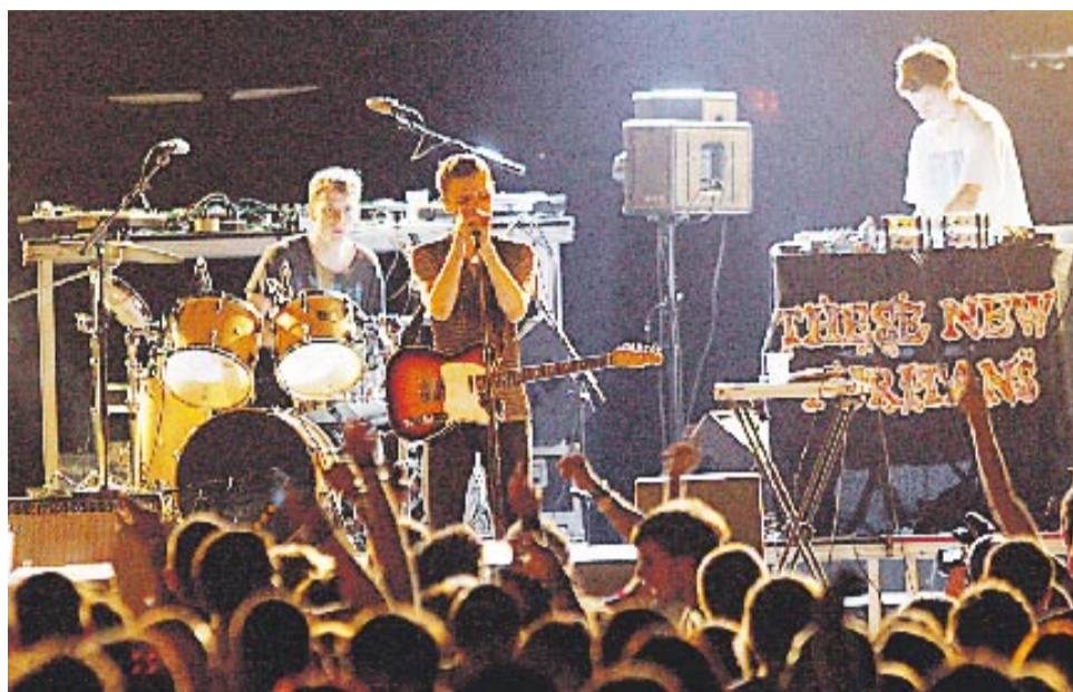
These New Puritans no van fer concessions i van resultar difícils de pair